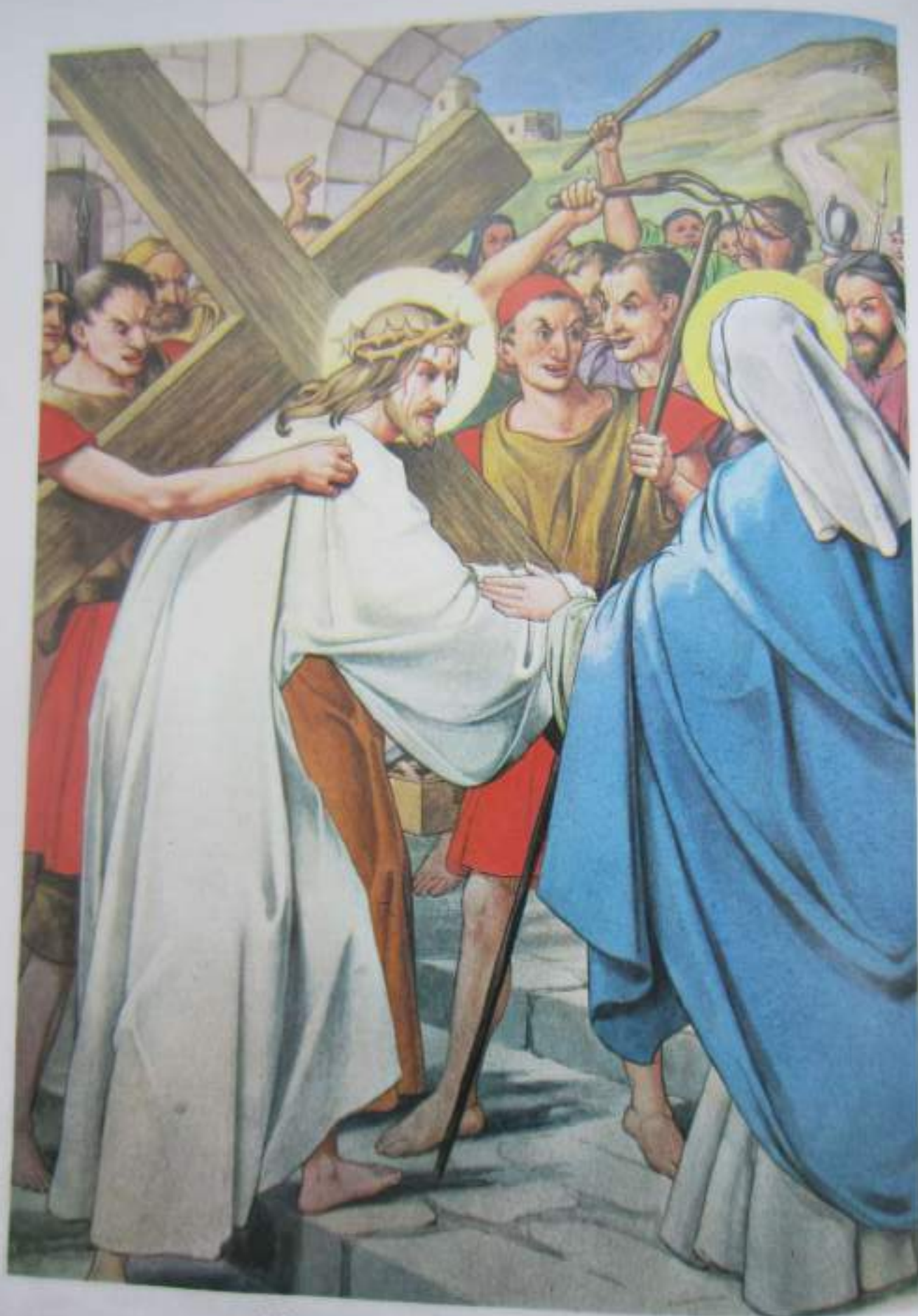
Camino del Calvario