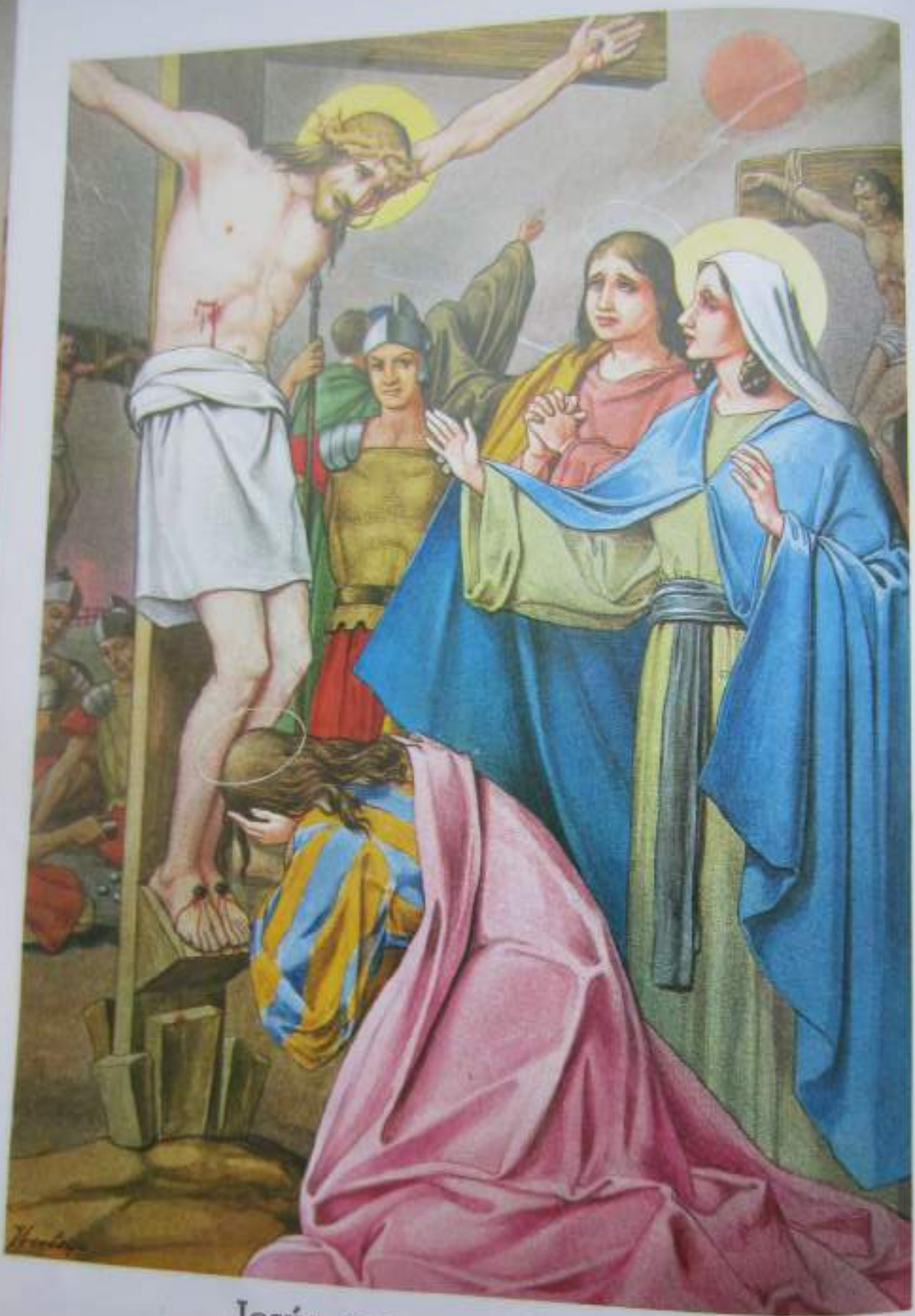
Jesús muere en la cruz