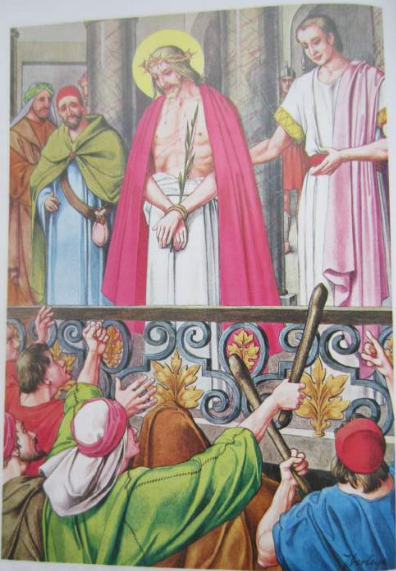
He aquí al hombre