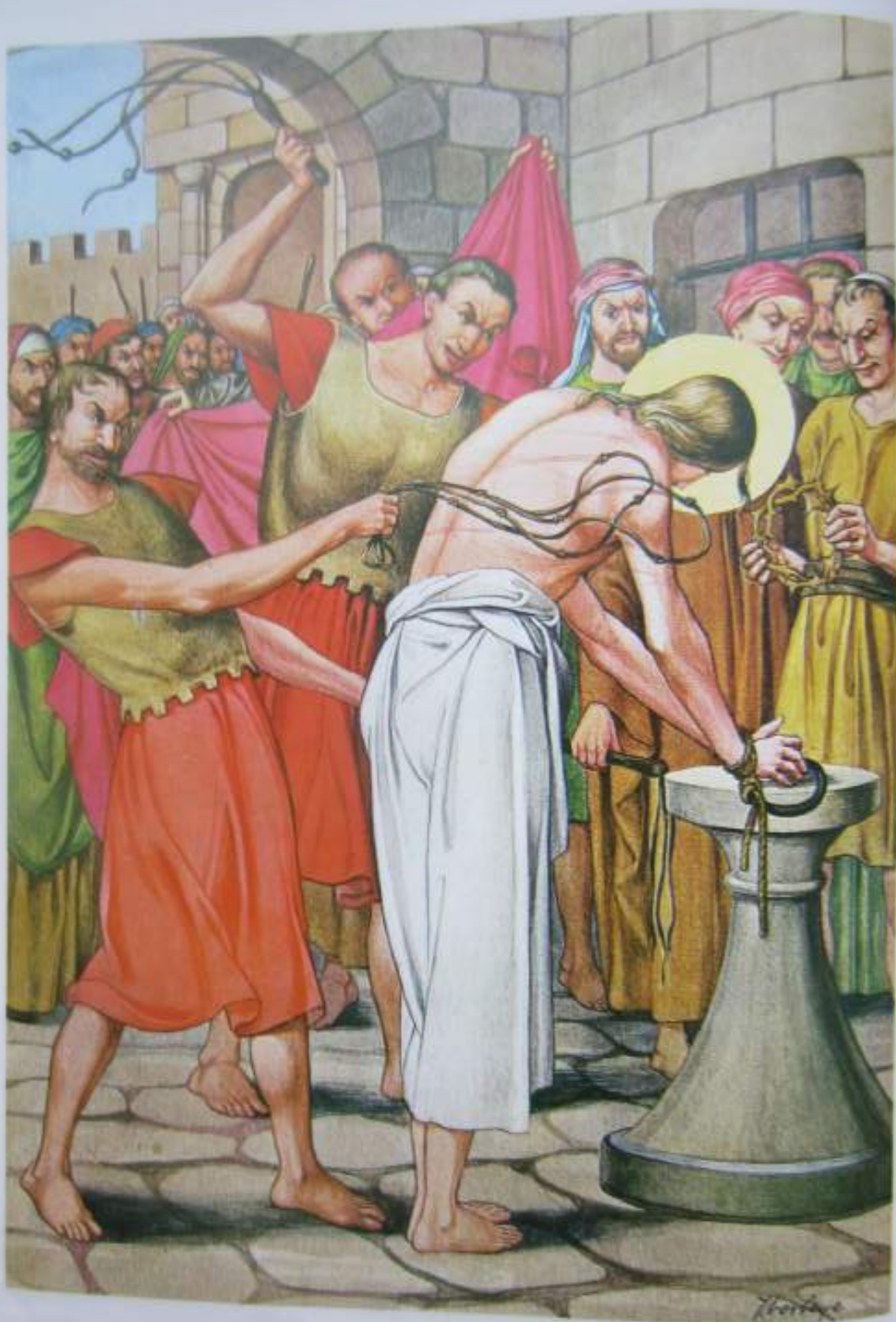
Jesús es azotado