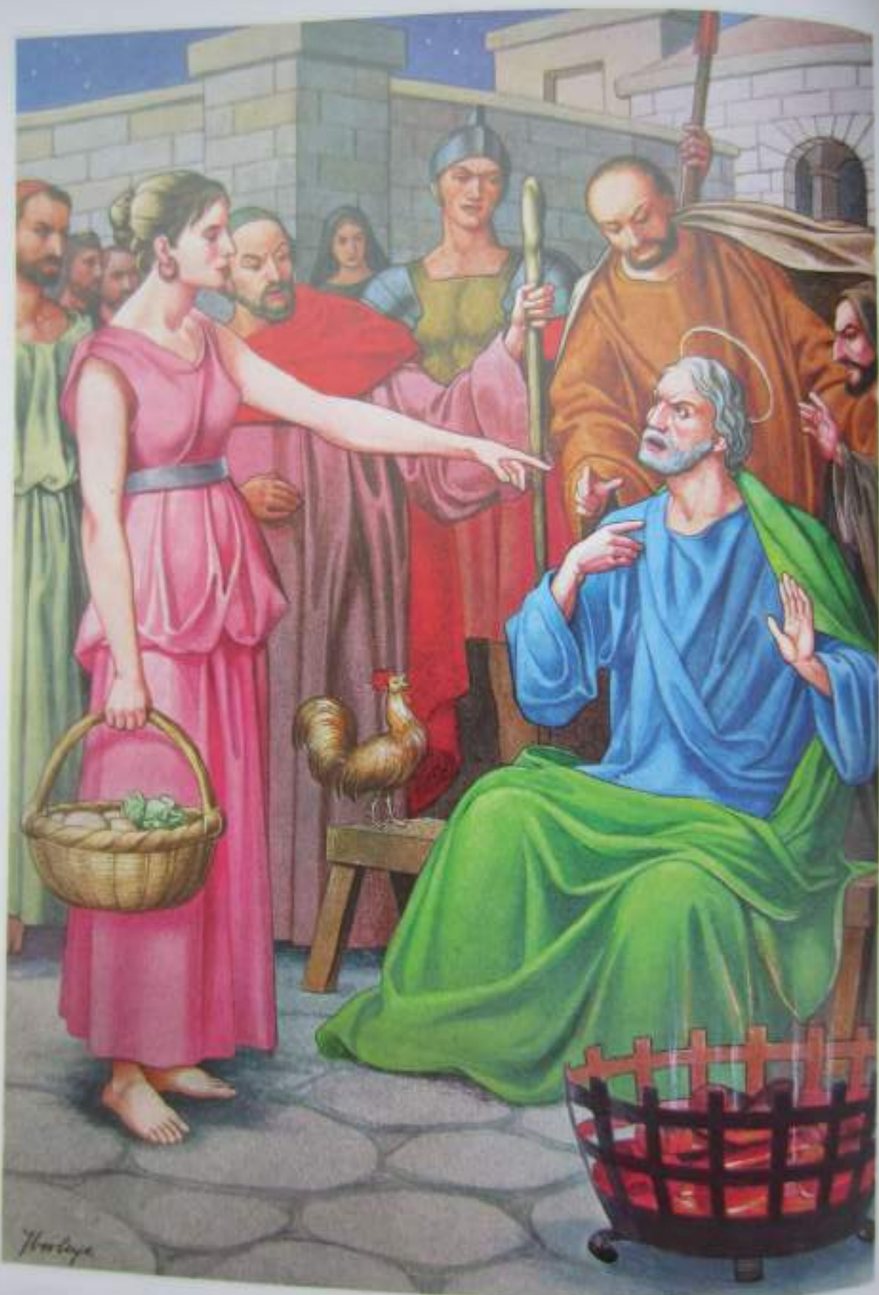
Pedro niega a Jesús